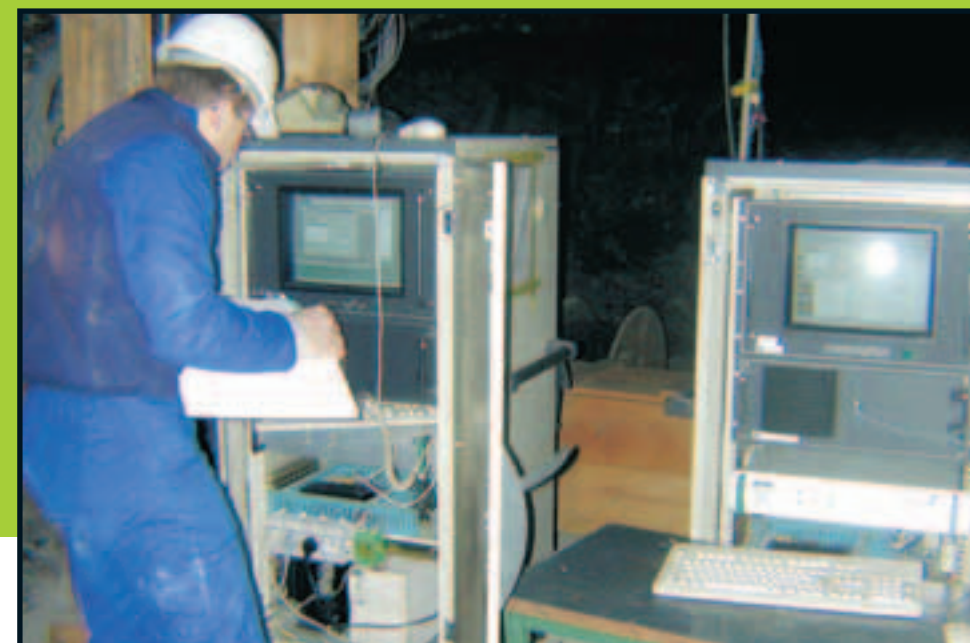
Surveillance microsismique sur le site pilote de Tressange.