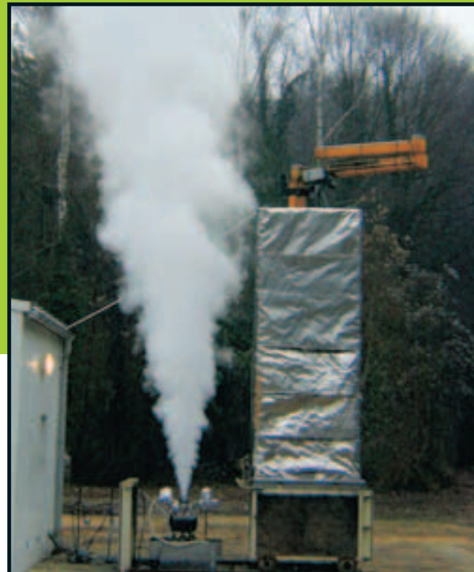
Essai de dimensionnement d'événement de citerne de matière dangereuse.